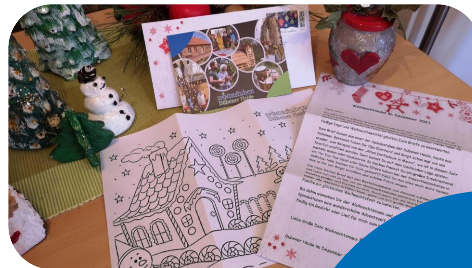
Bis zu 100 Briefe gilt es zu beantworten... hierfür freuen wir uns über fleißige Helfer!