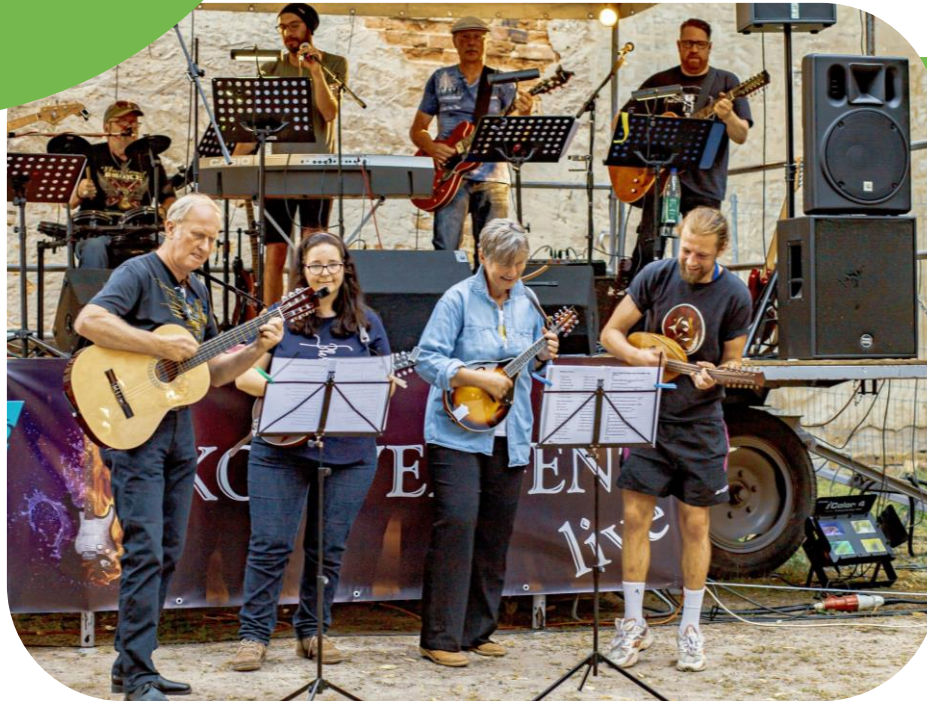
Auftritt als „Begleitact“ während eines Musikkonzerts in Bad Schmiedeberg

Neben Auftritten in der Dübener Heide, verschlug es einen Teil der Mandolinenspieler im November 2020 zum Jazzfest nach Berlin. Der Auftritt konnte live im TV verfolgt werden.