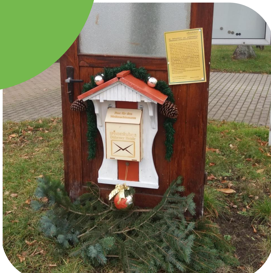
Das Weihnachtspostamt in Söllichau. Weitere Postämter stehen zur Weihnachtszeit in Meuro und Sachau.

Schon seit 3 Jahren rufen wir die Kinder der Einheitsgemeinde auf, unsere Weihnachtspostämter zu nutzen, um im Anschluss eine persönliche Antwort vom Weihnachtsmann zu erhalten.