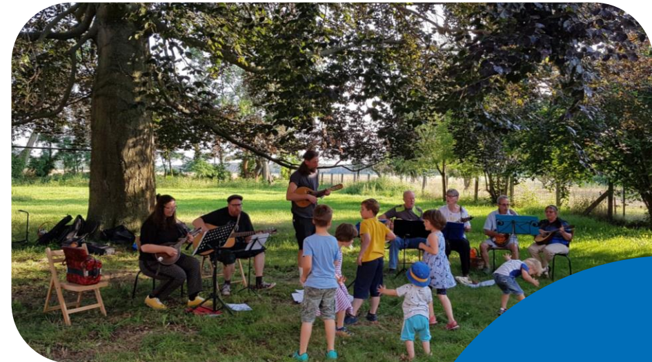
Klänge der Mandolinenspieler zum Sommerfest 2021 der Kirchgemeinde Söllichau

Im August 2019 gründete sich das Meuroer Mandolinenorchester aus der Spindestuben Initiative heraus. Seitdem konnten zahlreiche Gäste aus nah und fern die Klänge der Mandoline lauschen.