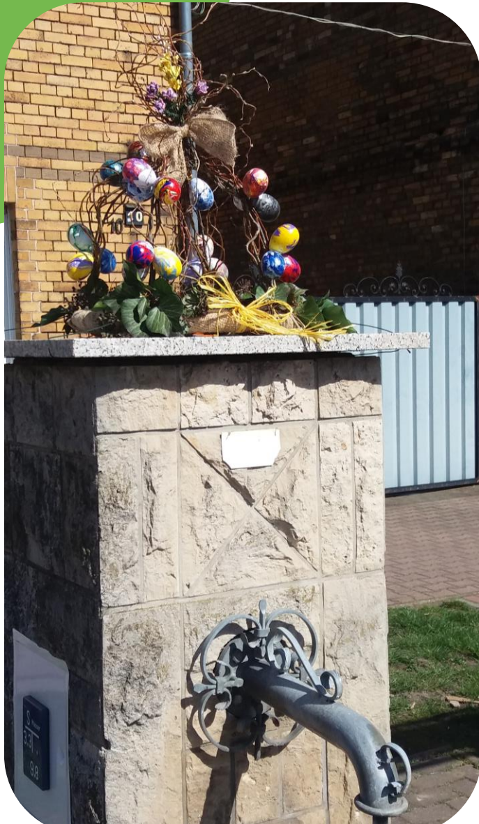
Osterkranz auf dem Röhrwasserbrunnen in Söllichau

Seit mehreren Jahren basteln Vereinsmitglieder mit fleißigen Helfern nun schon Osterkränze und dekorieren mit diesen die Orte in der Dübener Heide.