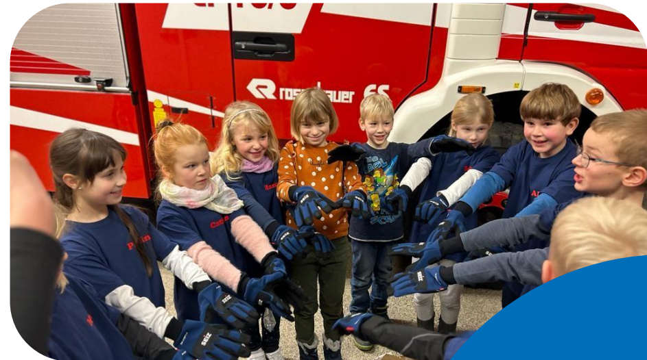
Dank der neuen Handschuhe sind sie bei den Übungen nun noch besser geschützt.