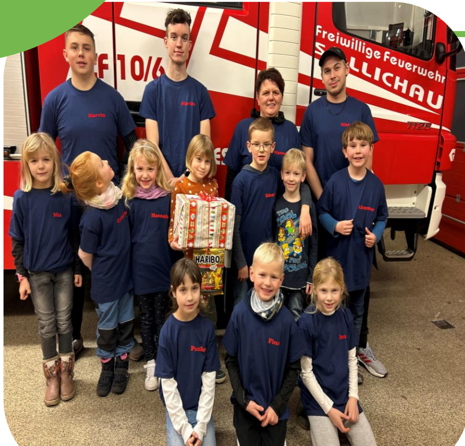
Aufstellung der Söllichauer Flammenhopsers zur Geschenkeübergabe

Im Januar 2023 konnten wir den Söllichauer Flammenhopsern einen Satz Jugendfeuerwehrhandschuhe überreichen. Die Anschaffung konnte aus dem Erlös der Kinderkleiderbörse realisiert werden.