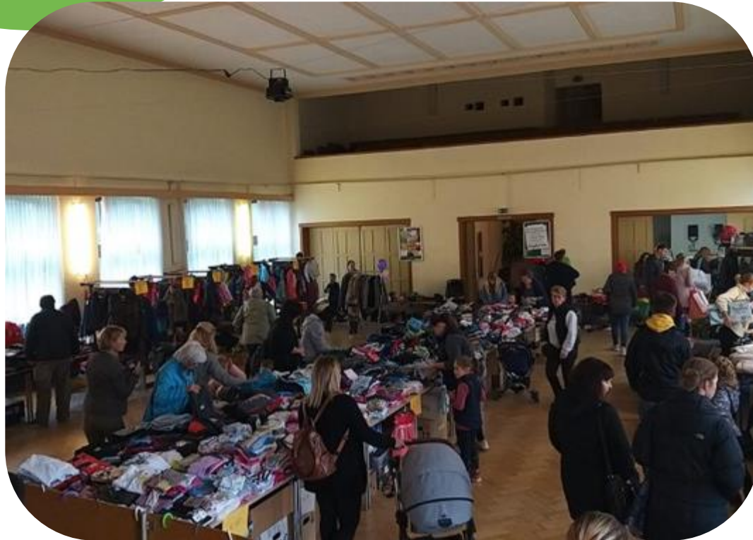
Im Kulturhaus in Söllichau findet einmal jährlich eine Kinderkleiderbörse statt.

Mit den Kinderkleiderbörsen möchten wir als Verein zur Nachhaltigkeit beitragen und einkommensschwache Familien unterstützen.