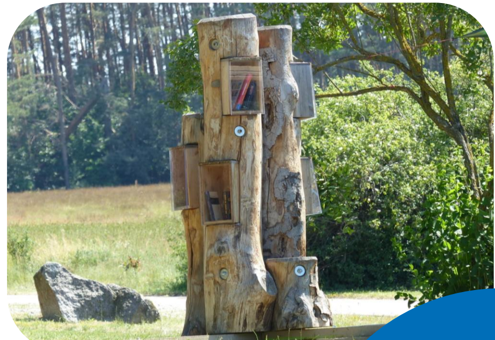
Im Juni 2019 wurde der Bücherbaum bei Gniest eingeweiht