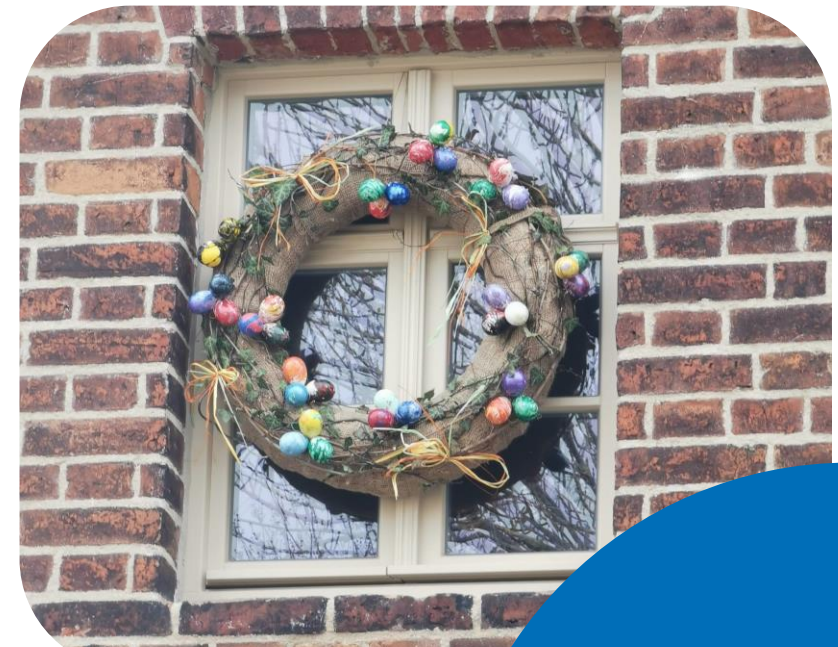
Osterkranz an der Alten Dorfschule in Meuro