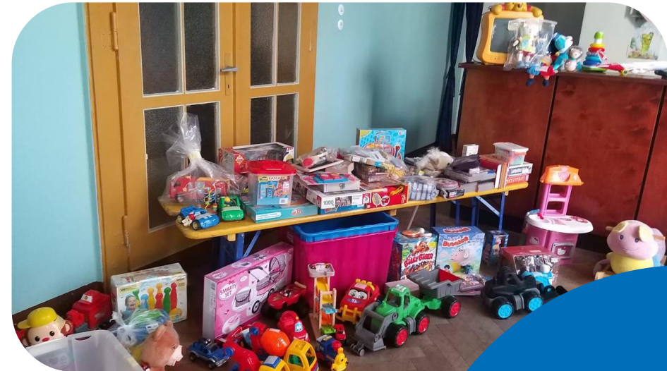
Neben Kleidung wechselt auch Spielzeug den Besitzer