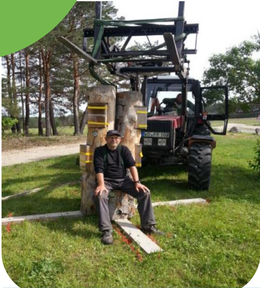
Der Bücherbaum ist in Gniest angekommen. Er wurde von einer Künstlerin aus Wittenberg gespendet