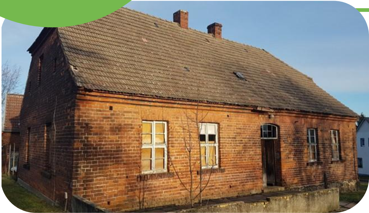
Die alte Dorfschule in Meuro von 1848 stand seit mehreren Jahren leer.