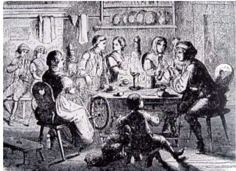
Zeichnung um 1890 angefertigt (Künstler unbekannt) zeigt die Landjugend bei der Arbeit am Spinnrad und bei allerlei Kurzweil in der Spinn- bzw Lichtstube

„Spinde: die, gesellige Zusammenkunft der jungen Leute an Winterabenden, Fortsetzung der Spinnstube;“