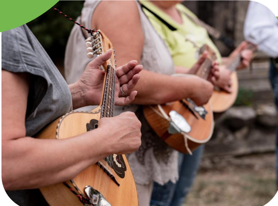
Aufstellung und Einweisung der Mandolinen vor Drehbeginn für ein Musikvideo des aus Köln, Berlin und Leipzig stammenden Musikensembles „BEYOND w/ BERNHARDT“

Im August 2019 gründete sich das Meuroer Mandolinenorchester aus der Spindestuben Initiative heraus. Seitdem konnten zahlreiche Gäste aus nah und fern die Klänge der Mandoline lauschen.