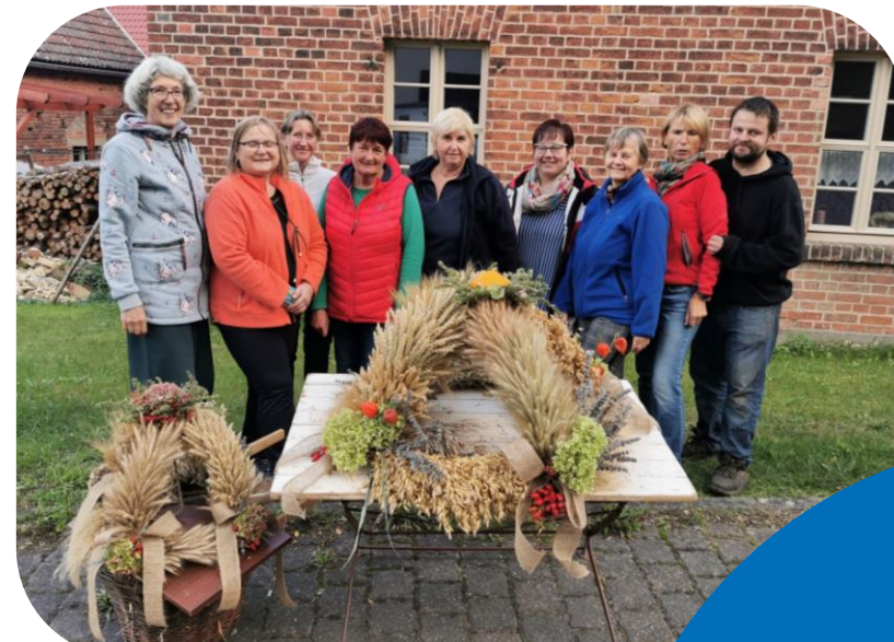
Bau von Erntekronen im Jahr 2022