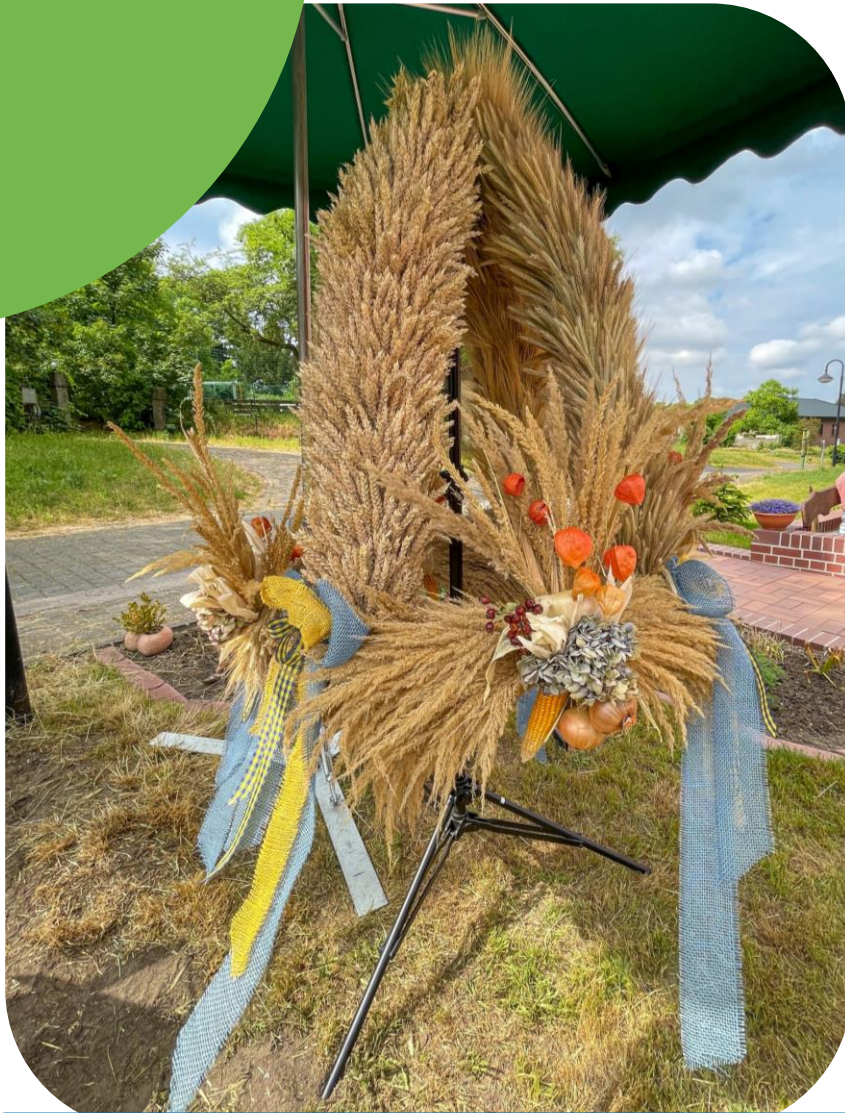
Eine Heidekrone von 2021, präsentiert zur Rundfahrt der Bürgermeister der Dübener Heide

Anlässlich des Erntedankfestes werden jedes Jahr aufs neue verschiedene Erntekronen für die Kirchen und Gottesdienste in der Dübener Heide gestaltet.