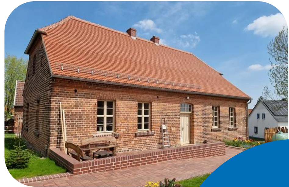
Nach der Sanierung im Jahr 2021 erstrahlt die Dorfschule in neuem Glanz